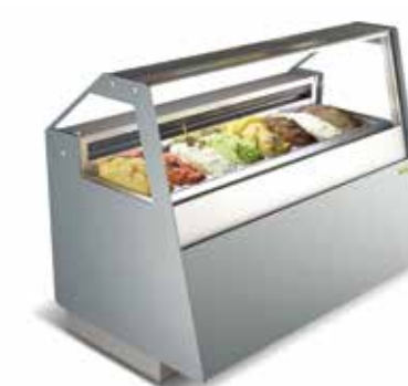
Barok SLM Konik