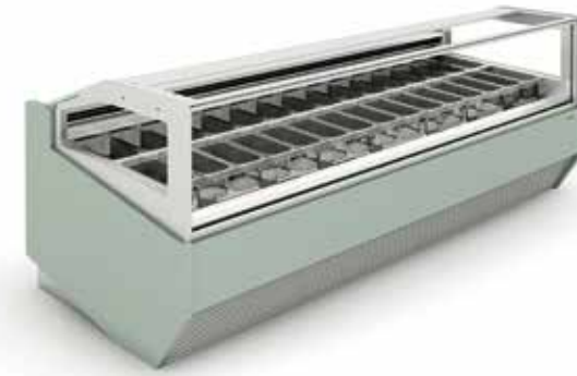
Smyrna Vision Long