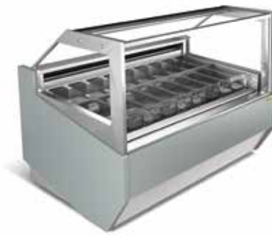
Smyrna Vision New