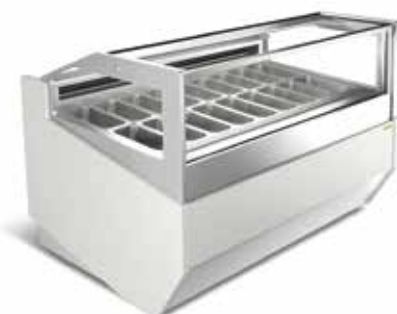
Smyrna New Low