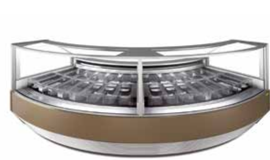
Smyrna Vision New S