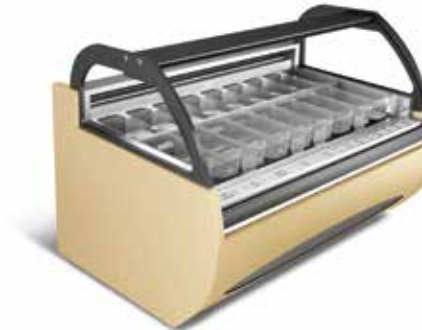
Troy Sport Vision